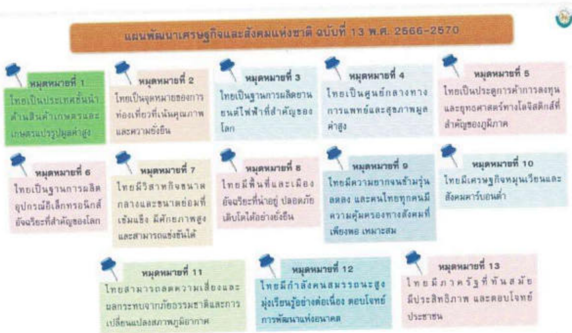
รูปภาพที่ 3 แสดงหมวดหมู่การพัฒนาแผนพัฒนาเศรษฐกิจและสังคมแห่งชาติ ฉบับที่ 13 พ.ศ. 2566-2570