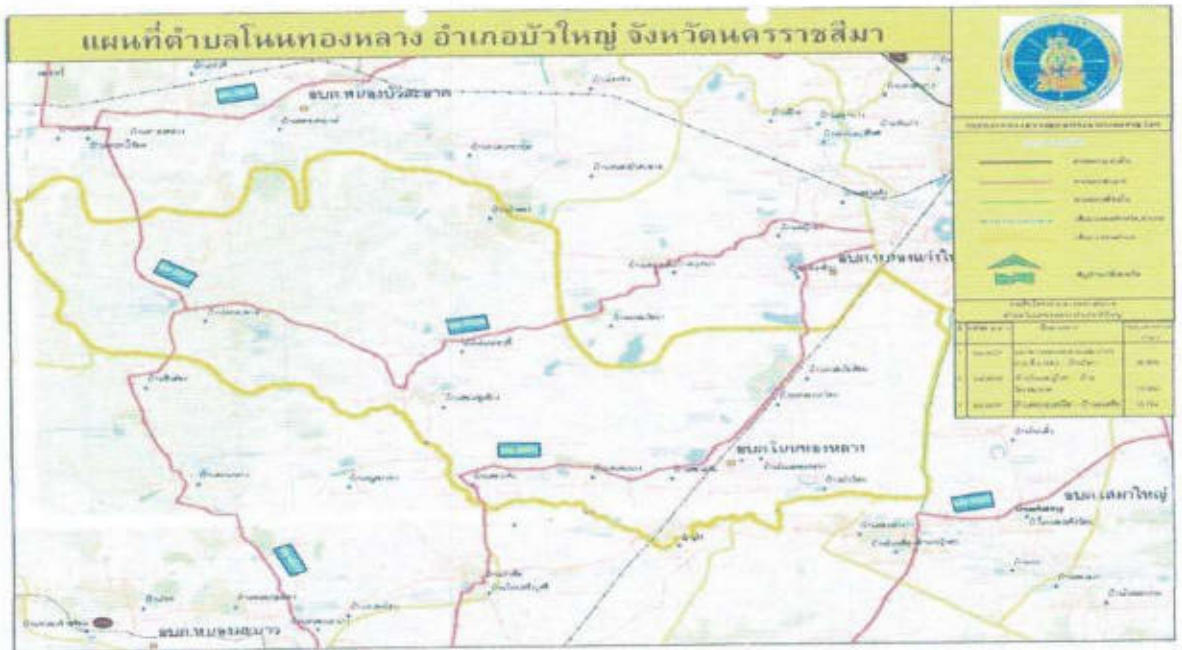
ภาพที่ 1 แผนที่ตั้งตำบลโนนทองกลาง