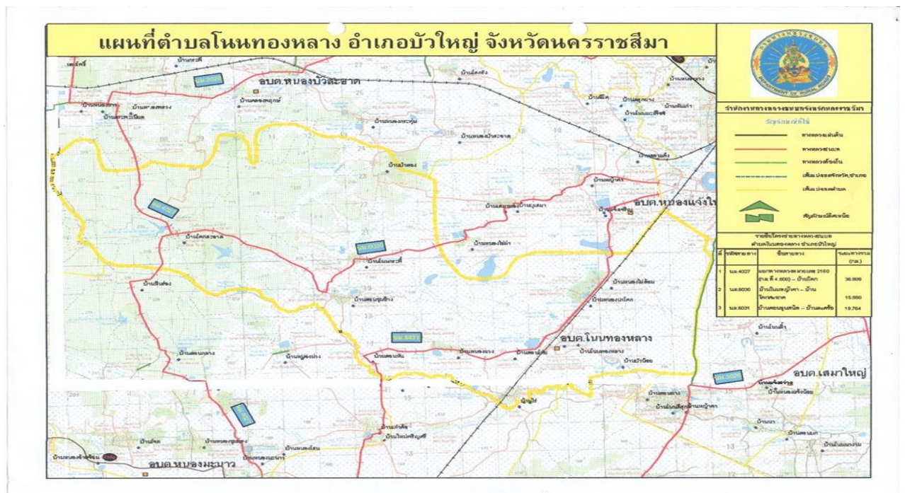
ภาพที่ 1 แผนที่ตั้งตำบลโนนทองหลาง